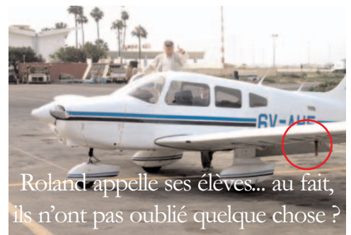
Roland appelle ses élèves... au fait, ils n'ont pas oublié quelque chose ?