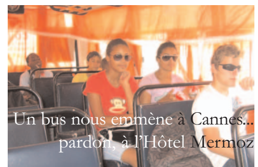
Un bus nous emmène à Cannes... pardon, à l'Hôtel Mermoz