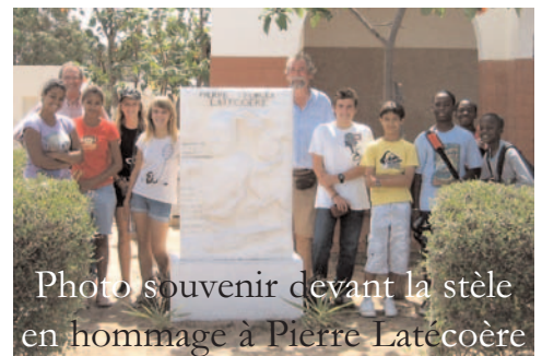
Photo souvenir devant la stèle en hommage à Pierre Latécoère