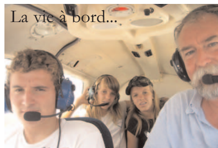
La vie à bord...

Splendide balade au-dessus des méandres du fleuve, en évitant de survoler la Mauritanie, toute proche... Verticale piste du Djoudj, en respectant la hauteur de survol : 1000 pieds minimum puis retour sur la Langue de Barbarie avant de nous poser une seconde fois à Saint-Louis.