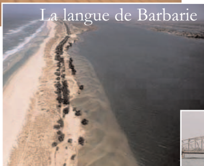
La langue de Barbarie

Une glacière remplie de boissons fraîches nous attend sur le tarmac et après une courte pause, les avions repartent pour le second vol de la matinée.