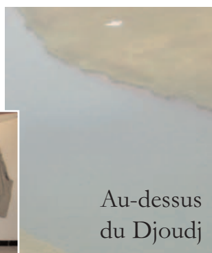
Au-dessus du Djoudj