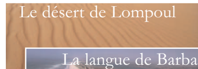
Le désert de Lompoul