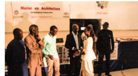
2017 - 1 ère promotion de Master Université de Thiès : promotion feu Pr Meissa FALL